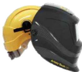
3: Adapter till skyddshjälm. Kan monteras på många fabrikat av skyddshjälm.