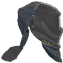
2: Huvud/nackskydd och bröstskydd

2 Bröstskydd i läder. 0700 000 062 2 Huvud- och nacksydd i läder. 0700 000 063 3 Adapter till skyddshjälm (Consept/Peltor) 0700 001 005