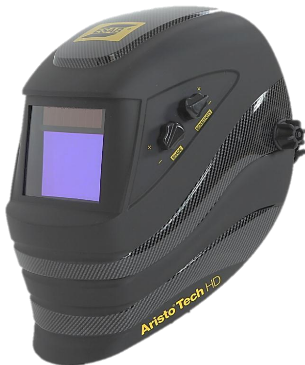
Aristo® Tech HD 5-13 med stort synfält, ny funktion X-TIG och modern design.

Svetshjälmens kassett är byggd på den senaste teknologin. För svetsaren visas aktuella inställda värden tydligt. Känslighet kan ställas in i 8 olika lägen, inkl slipläge. Fördröjningen, dvs tiden från mörk till ljus, anges i tiondelars sekunder från 0,1–3,5s.