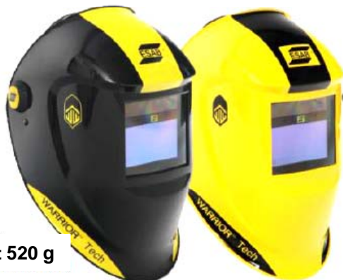
Vikt 520 g

Warrior™ Tech hjälmen har inbyggt batteri, som laddas av solceller. Detta innebär att batteriet laddas automatiskt och att du inte behöver byta batteri. Inbyggd energisparfunktion.