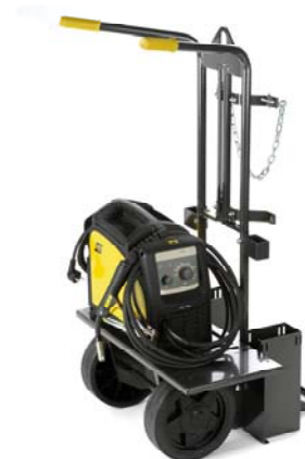
Caddy® Mig C160i placerad på 2-hjuls vagn Vid svetsning med skyddsgas rekommenderas vagn för transport och säkring av gasflaska.